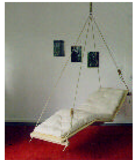
Modell Legend I