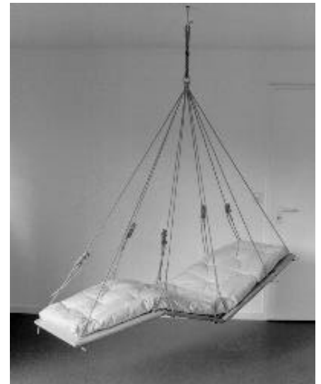
Modell Univers I