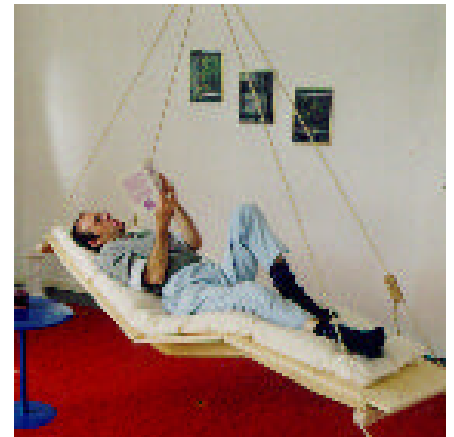
Modell Legend I